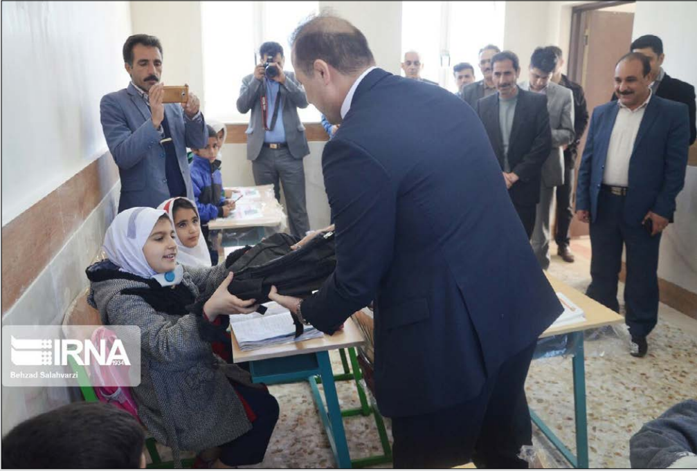
IRNA Behind Sabzharza

از دو مدرسه تک و سه‌کلاسه صبح روز گذشته با حضور مسئولان استانی، خیرین و بانک سازنده این مدارس در شهر سیل‌زده معمولان، بهره‌برداری شد.