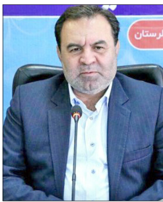
سپهرغرب، گروه استان‌ها: استاندار لرستان تأکید کرد: تغییر مدیریت در استانداری برای هماهنگی تیم مدیریتی استان بوده و هدف ما تند کردن قطار توسعه لرستان است.

استاندار لرستان با تأکید بر اینکه معنا ندارد استانی با ۱۲ تا ۱۳ میلیارد مترمکعب تولید آب، تنها یک میلیارد مترمکعب تخصیص آب داشته باشد، گفت: این در حالی است که یکی از سد‌های استان با ۴۰ درصد پیشرفت فیزیکی و به پنج میلیون مترمکعب آب نیاز دارد اما چندین سال است به دنبال تخصیص این