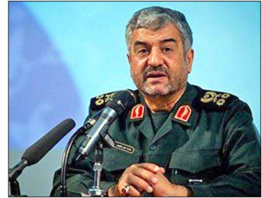
سسیه‌غرب، گروه ایران و جهان: فرمانده کل سپاه پاسداران انقلاب اسلامی گفت: در آینده‌ای نزدیک در یمن شاهد پیروزی خواهیم بود.

این شرط لازم دستیابی به دانشگاه تراز انقلاب اسلامی است اما توجه به ابعاد معنوی انقلاب اسلامی نیز در این مسیر باید مورد توجه باشد. وی با بیان اینکه مقام معظم رهبری تأکیدات فراوانی در موضوع تربیت پاسداران داشته اند، گفت: هدف دانشگاه علوم پزشکی بقیه الله نیز تربیت پزشکانی در تراز انقلاب اسلامی است. سرلشکر جعفری ادامه داد: داشتن روحیه جهادی تنها اسلحه به دست گرفتن نیست، آنچه مسلم است ما از تهدیدات دفاعی و امنیتی عبور کردیم و به سادگی می‌توانیم تهدیدات دفاعی و امنیتی را پاسخ دهیم و ساده‌ترین کار ما پاسخ دادن به این تهدیدات است. ما بزرگترین و سخت‌ترین تهدیدات دفاعی و امنیتی را پشت سر گذاشته‌ایم. موضوع دفاع و امنیتی امروز از مرزهای ایران فراتر رفته اما این به معنای از بین رفتن تهدید علیه انقلاب اسلامی نیست. فرمانده کل سپاه تأکید کرد: امروز تهدید اصلی انقلاب اسلامی تهدیدات نرم فرهنگی و سیاسی و اجتماعی است که اگر به آنها پاسخ داده نشود می‌تواند برای انقلاب مشکلات جدی به‌وجود آورد. وی عنوان کرد: از جمله ضرورت‌های پاسداری غیر محافظه کارانه از انقلاب اسلامی شامل خود سازی معنوی و بصیرتی، و حتی بصیرت سیاسی هم از ایمان ناشی می‌شود. در مرحله بعد تقویت روحیه ایثار و از خودگذشتگی است و این شاخصه ضرورت حرکت جهادی است. یکی از کارهایی که باید مراکز آموزشی سپاه انجام دهند تقویت همین روحیه است که البته کار بسیار سختی است و حتماً نیاز به کار عملی دارد که در این راستا ایجاد گروه‌های جهادی بسیار موثر است.