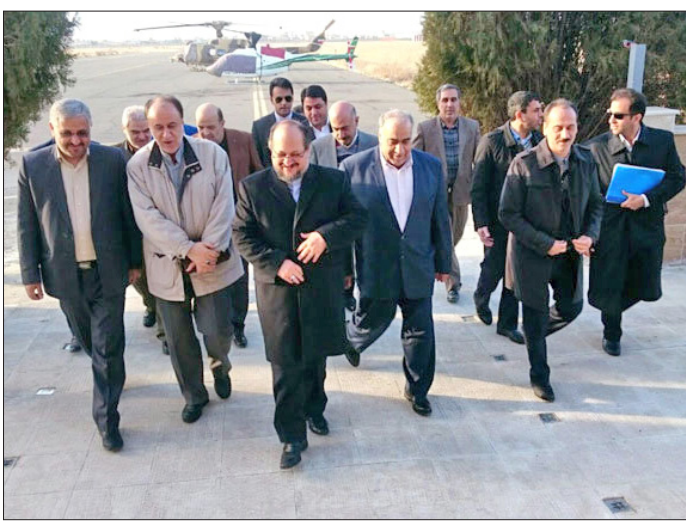
بین صاحبان واحدهای صنعتی تولید مصالح ساختمانی با مسؤولان استان برای بازسازی واحدهای تخریب‌شده در نقاط زلزله‌زده خواهد بود.

تعهد تأمین مصالح موردنیاز بازسازی واحدهای صنعتی مناطق زلزله‌زده که توسط انجمن‌های تخصصی پذیرفته شده شامل حدود ۴۰۰۰ تن آهن‌آلات موردنیاز برای سوله سازی، حدود ۱۰ هزار تن سیمان، حدود ۵۰ هزار مترمربع کاشی و سرامیک، حدود ۲۰ هزار تن کاشی و سرامیک و حدود ۳ هزار و ۵۰۰ تن گچ از دیگر مفاد این تفاهم‌نامه است.