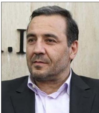
سپهرغرب، گروه استان‌ها - طاهره ترابی مهوش: نماینده مردم نهاوند در مجلس شورای اسلامی با بیان اینکه میزان اعتبار در نظر گرفته‌شده برای استان جای بحث دارد، اظهار کرد: به نظر بنده میزان اعتبار در نظر گرفته‌شده برای استان همدان به‌عنوان بودجه اندک است.

حال چانه‌زنی و ریزنی برای افزایش بودجه طرح و پروژه‌های حوزه‌های انتخابیه خود هستند، نهاوند به‌عنوان سومین شهرستان بعد از همدان و ملایر در استان همدان وضعیت پیچیده‌ای دارد، به‌نحوی که با نگاهی گذرا به وضعیت شهرستان نهاوند می‌توان گفت مشکلات فراوانی گریبان‌گیر است، به‌طوری‌که همدان بر این باورند که نهاوند در سال‌های گذشته در بیشتر حوزه‌ها پیشرفت و توسعه قابل‌قبولی نداشته است. از سوی دیگر باید گفت که توسعه امری درون‌زا بوده و مردم هر منطقه باید خود دنبال توسعه باشند و زمینه آن را فراهم نمایند، چراکه توسعه وقتی اتفاق می‌افتد که اراده‌ای جمعی از درون جامعه برمی‌خیزد و با بهره‌گیری از قابلیت‌ها، آینده‌ای روشن را با دستان قدرتمندش ترسیم می‌نماید. بنابراین برای رسیدن به یک راهبرد صحیح، ابتدا باید از وضع موجود شهرستان شناخت کامل داشت و محیط را خوب شناخت، مقصدورات و قابلیت‌ها را صحیح برآورد کرد، موانع و تهدیدات را دید و با ترسیم وضع مطلوب خط‌مشی را برای رسیدن به مطلوب تعیین کرد. بسر همین اساس باید در زمینه مشکلات و چالش‌های مهم شهرستان اعم از بخش‌های کشاورزی، صنعت، گردشگری، فرهنگی، عمران شهری و شهرداری‌ها، معادن، روستاها، توسعه