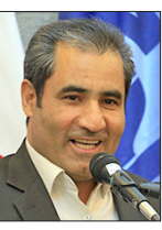
سپهرغرب، گروه استان‌ها: مدیر کل استانداردها و استاندار همدان با اشاره به اینکه با استفاده از استانداردهای ملی فرصتی مناسب برای تقویت کالاها و خدمات

این فعال حوزه گردشگری ادامه داد: تجربه شخصی بنده نشان داده‌است که خارجی‌ها از مدرنیته فاصله گرفته و به سمت آثار و منابع سنتی گرایش دارند، اشتیاق آن‌ها برای اقامت در مناطق بکر، صرف غذاهای سنتی و محلی و موارد دیگر نشان می‌دهد ما باید همه تلاش خود را در حفظ اصالت صنایع دستی، رسوم و فرهنگ اصیل خود به کار گیریم.