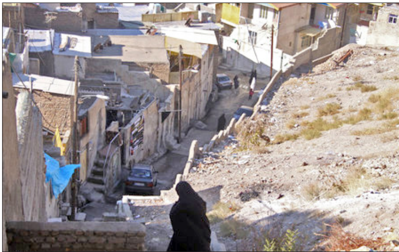
با تصویری که در ذهن داریم حاشیه‌نشینی نامید. هر چند هنوز مهم‌ترین شاخه‌های حاشیه‌نشینی را شامل فقر، رهاشدگی، فقدان امکانات، ضعف خدمات است که با خود به همراه دارند. دیزج، خضر، حصار نمونه‌های هستند که امروزه با توجه به توسعه شهری دیگر با نام‌های جدید مانند اسلامشهر، ولیعصر... در مجموعه شهری جامایی و تعریف شده‌اند.

بدون داشتن زیرساخت‌های بهداشتی و درمانی، آموزشی و خدماتی متناسب و نه حتی یک بوستان در دست و درمان برای نشستن. به قول یکی از ساکنین اینجاست که نه تنها هنوز مشکلات داخلی آن‌ها به قوت خود باقی مانده و در اصل موضوع تغییر چندان حاصل نشده، بلکه ساختار جدید خود این حاشیه‌ها نیز به حاشیه‌سازی‌های دیگر مبتلا شده‌اند. این موضوع شاید از نظر برخی مسردود و حتی تکیب می‌گردد با این حال وقتی شاهد وسعت‌گیری لبه‌های بیرونی این شهرک‌ها و متعاقباً ایجاد فازهای متعدد در آن‌ها هستیم، لاجرم باید پذیرفت که حاشیه‌نشینی نه تنها متوقف نشده، بلکه آشکارا در حال توسعه می‌باشد.