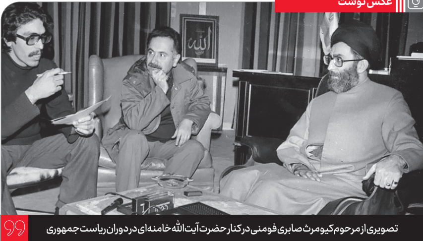
تصویری از مرحوم کیومرث صابری فومنی در کنار حضرت آیت الله خامنه ای در دوران ریاست جمهوری

حوزه [اصفهان]، تنها حوزه ای بود که در یک دوره، یک مجتهد و فقیه و فیلسوف زن - خانم امین - در آن پرورش یافت. مرحوم علامه طباطبایی رضوان الله علیه می گفتند من به اصفهان رفتم و با خانم امین ملاقات و بحث علمی کردم. آن موقع خانم امین، خانم مسن جا افتاده ای بودند و عمری از ایشان گذشته بود و شاگردان فراوانی