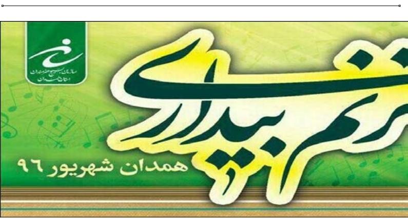
مراسم عید غدیر در شهر همدان، در روزهای ۱۳ شهریور ماه ۱۳۹۶. در این مراسم، کاروان غدیریون شامل ۱۱۰ دستگاه خودرو تزیین شده مردمی همزمان با عید غدیر خمر در شهر همدان برگزار می‌شود.

مدیر صندوق بیمه اجتماعی عشایر، روستاییان و کشاورزان استان همدان خاطرنشان کرد: از انتهای سال ۹۱ تا پایان سال ۹۵، با ۷۹ درصد رشد در جذب و ثبت‌نام توانستیم بیش از ۳۳ هزار نفر را به عضویت صندوق بیمه اجتماعی عشایر، روستاییان و کشاورزان درآوریم.