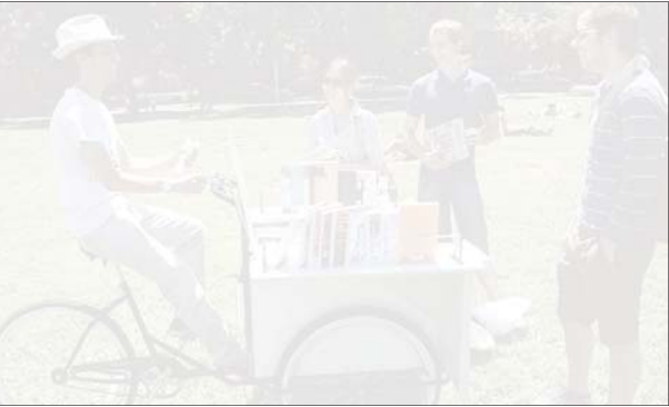
کتابخانهٔ دانشگاه تهران، یکی از مراکز کتابخانه‌های ایران

کتاب‌های منتشر شده در بازه زمانی مورد بررسی از سوی ۳هزار و ۵۸۴ ناشر انتشار یافته که از این تعداد ۳۶۶ ناشر، ناشران موردی و ناشر مولف بوده اند. همچنین تعداد ۷۶۶ ناشر از ناشران فعال در ۶ ماه نخست سال ۹۴ تنها یک عنوان کتاب منتشر کرده اند و فقط ۲۰ ناشر بیشتر از ۱۵۰ عنوان کتاب داشته اند.