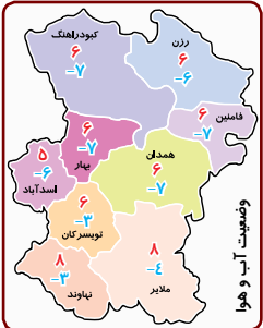
استان های هگمتانه

گزارش اندوه در ۲۵۰ صفحه و با قیمت ۳۷ هزار تومان توسط انتشارات نیستان روانه بازار خواهد شد.