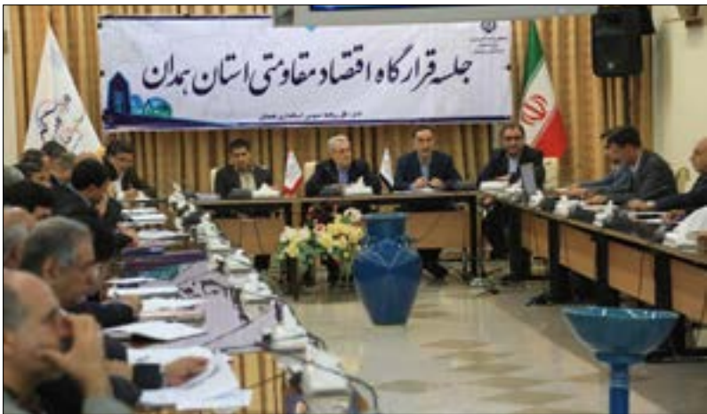
عراقی: به نیروگاه شهید مفتح گازسانی می‌شود

نیروهای آن در واحدهای صنغی جایجا می‌شوند اشاره و اظهار کرد: تأمین اجتماعی بیمه شده‌های اصناف را در آمار بیمه‌های اجباری خود ندارد.