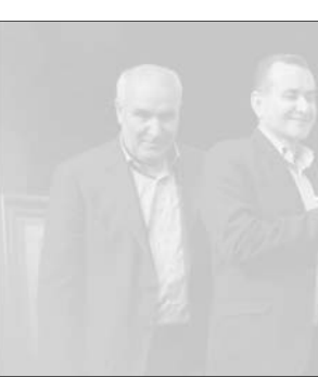
موسیقی صد برنامه و بیش از ۱۵۰ نمایش در طول سال به روی صحنه رفت.

میرمعینی اظهار کرد: در استان همدان حدود ۸ تا ۹ درصد اضافه وزن و چاقی گریبانگیر کودکان است و بالای ۷۰ درصد همدانی‌ها چاق‌اند.